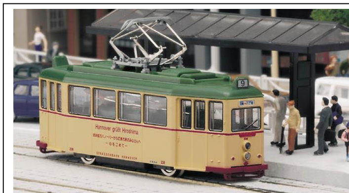
Art.-Nr. K14071-1 – Straßenbahn DÜWAG T2